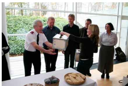
Kirkernes klimastafet blev sat i gang på Økumenisk Efterårskursus om kirken og klimaet.

Ugen efter, d. 31. oktober-1. november samlede økumenisk efterårskursus ca. 120 deltagere under overskriften Klimaet og kirken - hvad ved vi og hvad tror vi . Her var der teologiske og praktiske foredrag, bl.a. med udgangspunkt i den engelske kirkes projekt Shrinking our footprint . Ved en afsluttende økumenisk skabelsesgudstjeneste blev Kirkernes Klimastafet skudt i gang. Repræsentanter fra alle de deltagende kirkesamfund fik udleveret en kasse med tre objekter