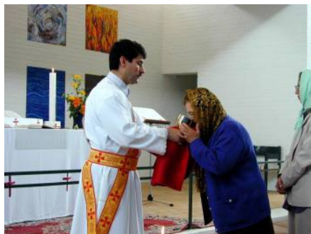
Assyrisk gudstjeneste i Skjoldhøj Kirke i Tilst ved Århus.

Ny undersøgelse kortlægger forholdet mellem kristne migrantmenigheder og lokale sognekirker.