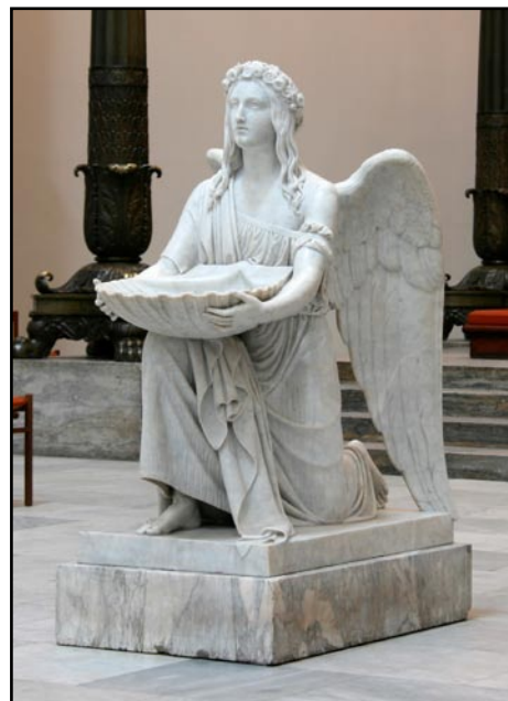
Døbefonten i Københavns Domkirke

Som noget helt nyt er spørgsmålet om den præcise formulering af dåbsordene ("Jeg døber dig i Faderens og Sønnens og Helligåndens navn) kommet til debat. Anledningen er at nogle præster fra flere forskellige kirkesamfund har døbt i "Skaberens, Frelserens og Livgiverens Navn" eller lignende i stedet for den traditionelle formulering. Reaktionen herpå har været forskellige: Den romersk katolske Kirke har afvist at anerkende dåb uden de traditionelle dåbsord, mens fx Den norske Kirke anerkender en sådan dåb, men det er dog ikke tilladt præsterne at benytte sig af denne praksis.