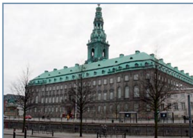
Lovforslaget om stiftsråd behandles i disse uger i Folketinget.

Der er fremsat lovforslag i Folketinget om etablering af permanente stiftsråd. Loven er endnu ikke vedtaget, men meget tyder på, at der under alle omstændigheder vil ske ændringer i organiseringen af det kirkelige liv i stifterne. Det vil også betyde nye rammer for det mellemkirkelige arbejde.