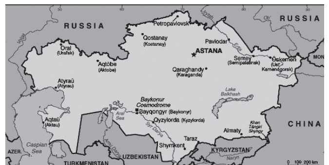
Kort: Cia World Fact Book