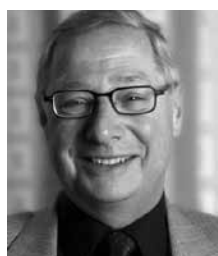
Biskop Erik Norman Svendsen Til og med august 2009 udpeget af Kirke- ministeren