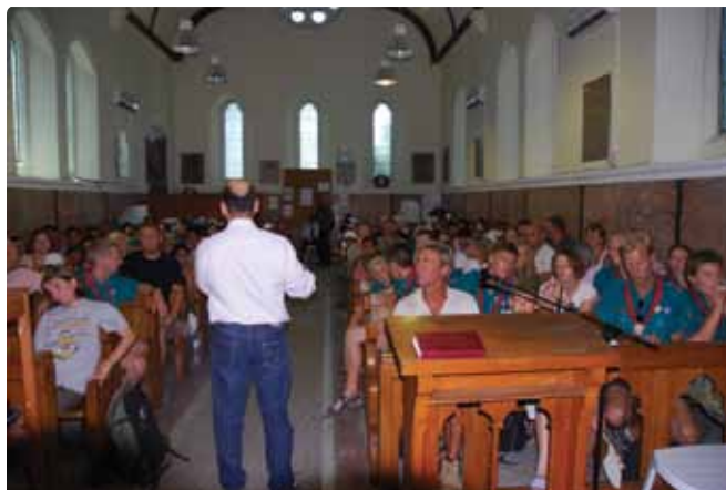
Besøg i Tunesien.

I det forløbne år, har mange kirkelige møder været præget af miljø, klima og klokkringning. Kirken er ikke kun tilskuer men aktiv i hverdagen, hvilket kan give anledning til mange diskussioner mennesker imellem. Den grønne kirke er kommet på landkortet i Roskilde Stift.