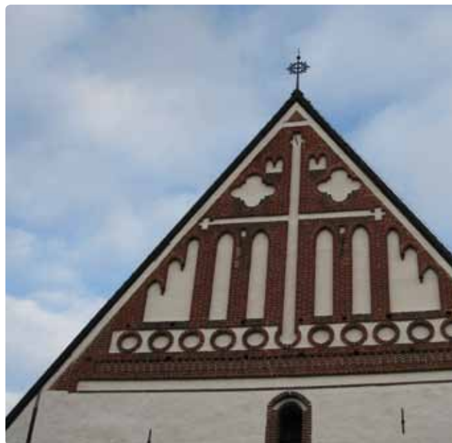
Porvoo Domkirke.

Hele Porvoo Erklæringen kan læses på Folkekirken mellemkirkelige Råds hjemmeside.