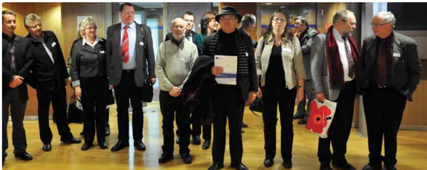
Besøg i Europa-Parlamentet.

I foråret 2009 afholdt Folkekirken's mellemkirkelige Råd en studietur til Bruxelles med deltagelse fra både bispekollegiet, Rådet samt en række kirkelige organisationer.