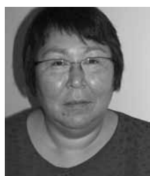
Biskop Sofie Petersen Grønlands Stift