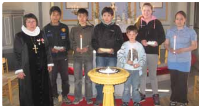
Konfirmander fra 2009 med klimastafetten i Nuuk.

Det mellemkirkelige stiftsudvalg for Grønlands Stift hvilede dog ikke på laurbærene. Den 22. oktober trådte udvalget sammen igen i Nuuk for at starte sit arbejde op fra den nyslåede platform. Vedtægterne blev revideret, og et nyt e-forum under stiftets hjemmeside for udvalget blev præsenteret. Forskelligt mellemkirkeligt materiale blev besluttet oversat til grønlandsk. Udvalgsmedlem Rebekka Lennert fra Qaqortoq arbejder i øjeblikket desuden på en pjece om forskellige trosretninger repræsenteret i Grønland. Klimaspørgsmålet var den store samlende faktor for det mellemkirkelige arbejde i