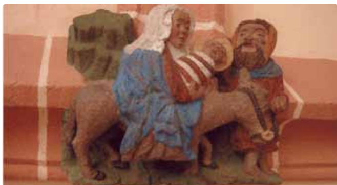
Detalje fra den nyrestaurerede Kunigunden Kirche.

Aalborg stift har siden 1989 været venskabsstift med Den evangelisk-lutherske Landeskirke i Sachsen. I 1991 fandt første besøg fra vort stift sted efter invitation fra Rochlitz Kirchenbezirk beliggende midtvejs mellem Leipzig og Dresden. Siden har vi på skift besøgt hinanden, og i september i år var ti mennesker fra vort stift på besøg i Rochlitz. I år genså vi flere af deres nu fuldt restaurerede kirker og de skønne naturområder. Efter en rundgang i byen Dresden oplevede vi en musikandagt i Frauenkirche med en efterfølgende orientering om kirkens genopbygningsproces.