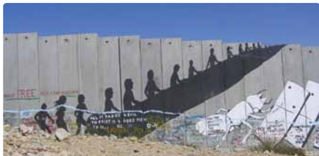
Muren.

Livet for dem kan på ingen måde kaldes nemt: de kristne er i klemme mellem stærke jøder og israelere samt muslimer, der både føler sig undertrykte, men også bevidste, og ofte lidt aggressive overfor de magtfulde israelere. Midt i denne kamp befinder de kristne palæstinensere sig. De bliver klemmt politisk og økonomisk, og de kan ikke færdes frit i de områder, de bor i. Der er blevet bygget en mur, 6 meter høj og ca. 700 km lang rundt om de palæstinensiske områder, sådan at man lever i en form for fængsel. Bosættelserne breder sig ind på palæstinensisk jord og fjerner dermed livsgrundlaget for mange oliventræsdyrkere, fårehyrder og andre former for familiebedrifter.