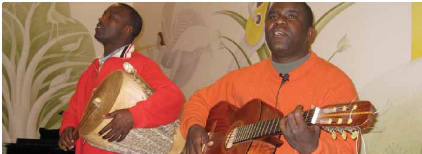
Tanzanianske rytmer til salmesangen.