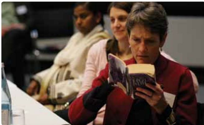
“Til kilderne...”.

Det teologiske arbejde har altid været en vigtig del af arbejdet i Det lutherske Verdensforbund (LVF), ligesom den teologiske identitet og teologiske studier er vigtig for lutherske kirker rundt om i hele verden. Siden 2006 har LVF gennemført et studieprogram om teologien og dens betydning for kirkernes liv. Blandt emnerne som her er blevet behandlet er bl.a. de lutherske kirkers bidrag i mødet med andre religioner; forholdet til religiøs fundamentalisme og forholdet mellem kirke og samfund. Studieprogrammet blev afsluttet med en stort anlagt konsultation i marts 2009 i den tyske by Augsburg,