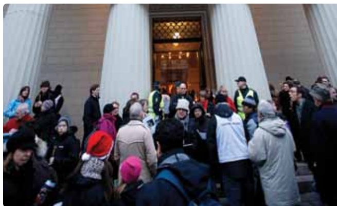
Vor Frue Kirke i København.

Tirsdag den 15. december var stiftsudvalget vært for en frokost i København for en international gruppe af kirkelige repræsentanter, som søndag deltog i den økumeniske gudstjeneste i Københavns Domkirke i anledning af FN's klimatopmøde i København. Om formiddagen havde de deltaget i et seminar i