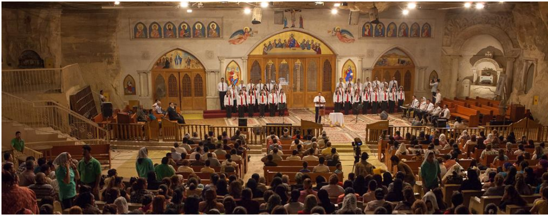
Et lille udsnit af zabalinerne "klippekirke", som var godt besøgt

Børnene til de døde under revolutionen på Befrielsespladsen fik 1500 pund om måneden som kompensation. Vores egne forældreløse børn får ikke kompensation fra staten."