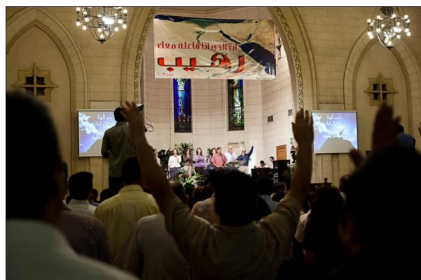
Gudstjeneste i den evangeliske kirke nær Tahrir pladsen