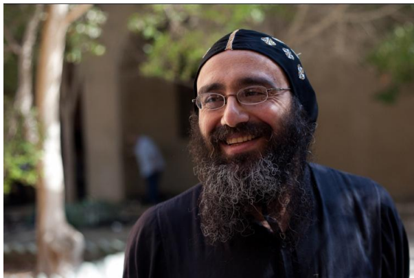
Munk i Macarius Klosteret, som guidede os rundt

En munks hverdag begynder kl. 03.00, hvor man bliver vækket for at kunne være med til Midnight Prayer kl. 04.00. Dagen er inddelt i faste rutiner med både fysisk arbejde og bøn, og som vores munk med smil om læben fortalte os: "Vores vigtigste arbejde er bønnen!"