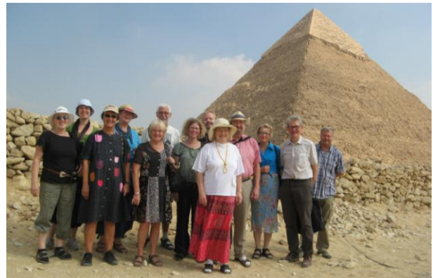
De fleste studietursdeltagere fik tid til en tur ud til Guiza-pyramiderne

Om formiddagen var de fleste ude at beundre pyramiderne og sfinxen. Derefter gik turen i bus til CEOSS, der står for Coptic Evangelical Organization for Social Services.