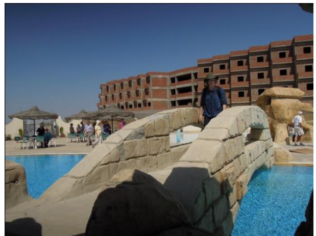
Zabelinernes swimming pool og ferielejligheder.

Der arbejdes også med planer om lokaler til store konferencer, og der var planer om en udvidelse med en stor konferencsal. Stedet bruges desuden allerede som et sted, hvortil