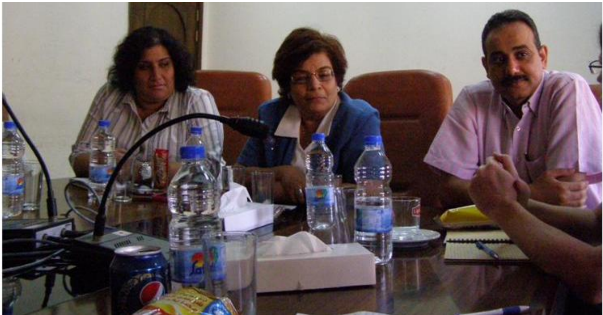
Repræsentanterne for CEOSS svarer på spørgsmål

På spørgsmålet om de kristnes situation i Ægypten fik vi det svar, at det kristne mindretal skal spørge sig selv, hvordan de kan blive et effektivt mindretal, der kan hjælpe medborgere. Der skete overgreb på kristne og deres ejendom i forbindelse med revolutionen, hvor politiet var sat ud af spillet, men militærrådet er ifølge CEOSS opmærksomme på problemet og hjælper. Vi fik, hvad der i lyset af andre indtryk må opfattes som et skønmaleri af forholdet mellem koptere og det øvrige ægyptiske samfund.