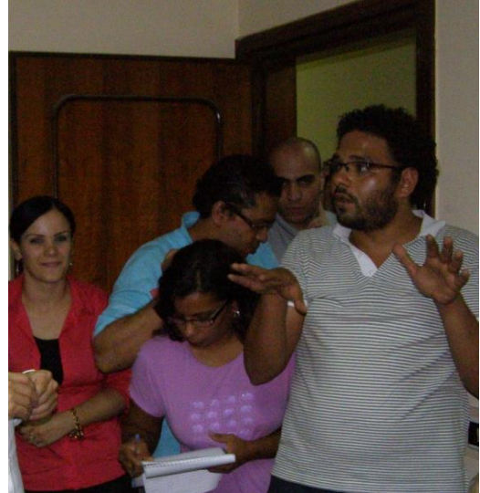
Et udsnit af de unge fra netværksgruppen fra Tahrir pladsen

På det praktiske plan arbejdede de med en række tiltag. De var i gang med at oprette ungdomskomiteer / råd. De havde allerede etableret råd i 10 guvernater. I det hele taget havde de intentioner om, at der måtte en bevidstgørelsesproces og holdningsbearbejdning i gang, især ude på landet, hvor folk naturligt nok er mere optaget af hverdagens problemer. Endvidere skulle der oplyses om basale demokratiske ting som lister, afstemning, valgkort etc. Ægypterne skal læres op i organisering. Der er meget at lære, når man stadig er under 1 år i demokratisk forstand.